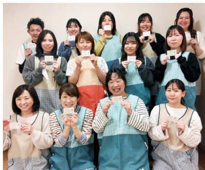
おはよう保育園 南砂町